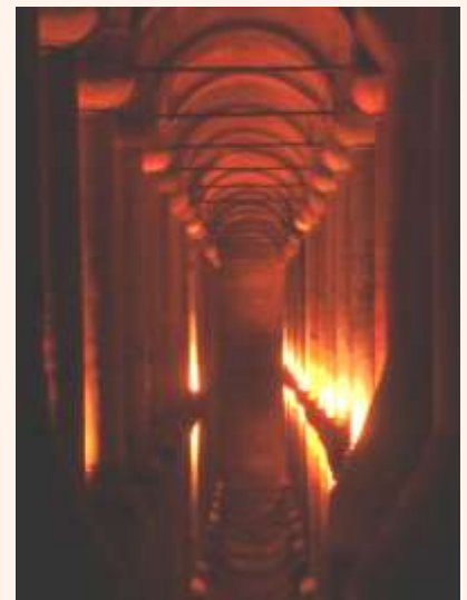
Zisterne des Topkapi-Palastes

Eine Reise dahin ist ein Erlebnis und für viele wird es auch dann zur „Sucht“.